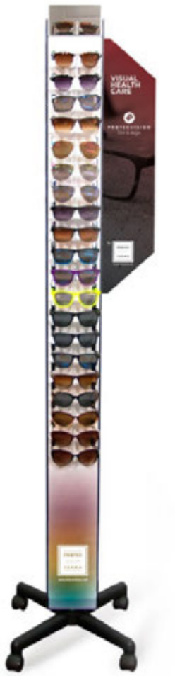
Expositor de 40 gafas Affichage 40 verres Exibição de 40 vidros Display 40 glasses Ref.: PF00008